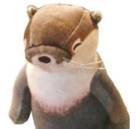
図書館マスコット カワウソ